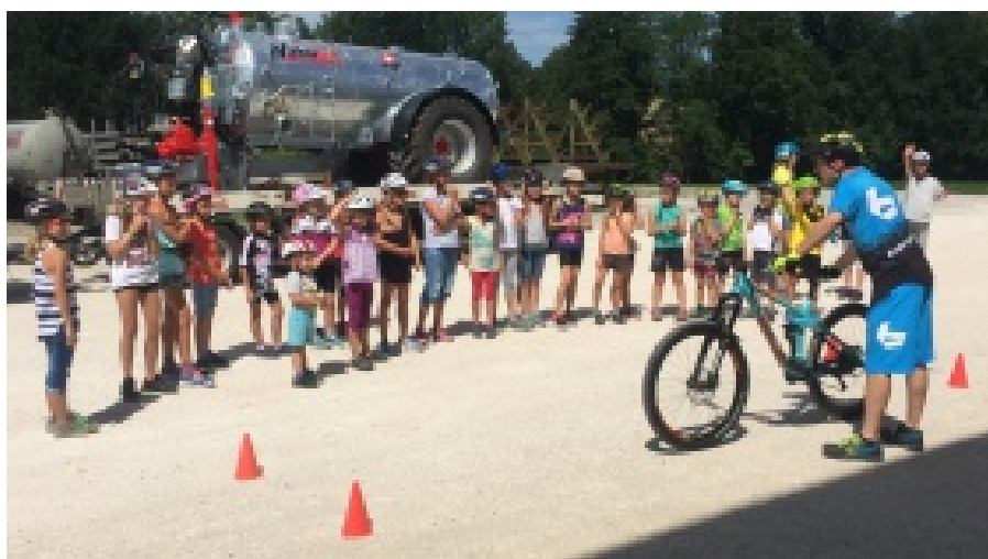
22 Kinder nahmen beim Fahrradsicherheitstraining teil; Foto: Elternverein Nußbach

und Bremstechnik geübt. Danach gab es eine kurze Stärkung bevor es auf dem Parcours mit Wippe, Wellenbrett, Rampe und Abfahrt ging. Alle waren gefordert und haben mit Bravour die Übungen absolviert. Zuletzt durften auch noch die Eltern den Parcours testen.