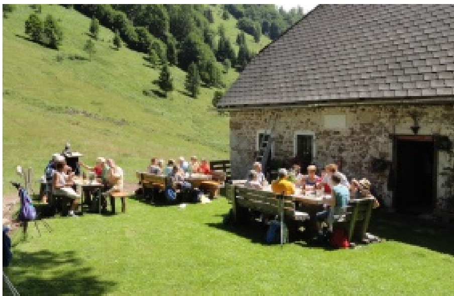
Rast auf der Blumaueralm; Foto: Seniorenbund Nußbach

Seehöhe am Fuße des Sengsengebirges. Sie ist nicht bewirtschaftet, aber wir erhielten die Erlaubnis dort eine Rast einzulegen und uns mit der mitgebrachten Jause zu stärken. Den herrlichen Wandertag ließen wir nach einer kurzen Einkehr im Jagahäusl zufrieden ausklingen.