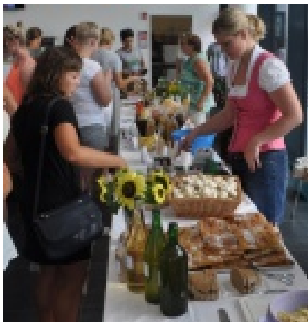
Verkaufsmarkt der Direktvermarkter aus der Region, Foto: Landjugend Nußbach

Von Gemüse, Kleidung, Gebäck, Milch, Fleisch, Teigwaren bis Gewürzen war alles vorhanden und kam bei den Besuchern sehr gut an, die sich das eine oder andere Produkte auch mit