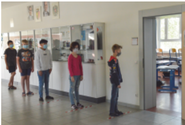
Maskenpflicht und Abstand halten!

Eine besondere Herausforderung stellen natürlich die Hygienemaßnahmen der Regierung dar. Wir bemühen uns aber, die geforderten Abstände, das Desinfizieren und regelmäßige Händewaschen einzuhalten. Mittlerweile haben sich unsere SchülerInnen daran gewöhnt, am Morgen etwas mehr