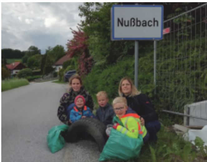
Sogar Autoreifen wurden gesammelt!

Danke an alle Freiwilligen, die sich für die Aktion Zeit genommen haben und so viele Säcke gesammelt wurden.