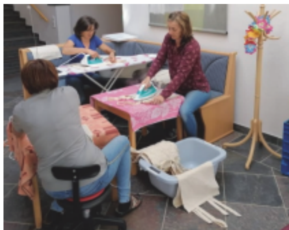
Die fleißigen Damen beim Nähen der MNS-Masken

Wir hoffen auf eine baldige Rückkehr zur Normalität, besonders für unsere Kinder.