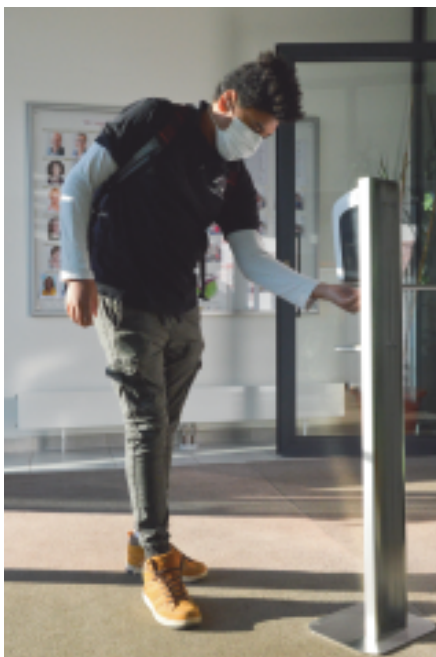
Der neue kontaktlos Desinfektionsmittelspender

Seit Montag, 18. Mai, sind wir am Schulstandort quasi wieder im Vollbetrieb, unsere SchülerInnen allerdings im Schichtbetrieb. Wir haben uns, da vom Bildungsministerium freigestellt, für die Variante des täglichen Wechsels der beiden Schülergruppen entschieden. So kann im Un-