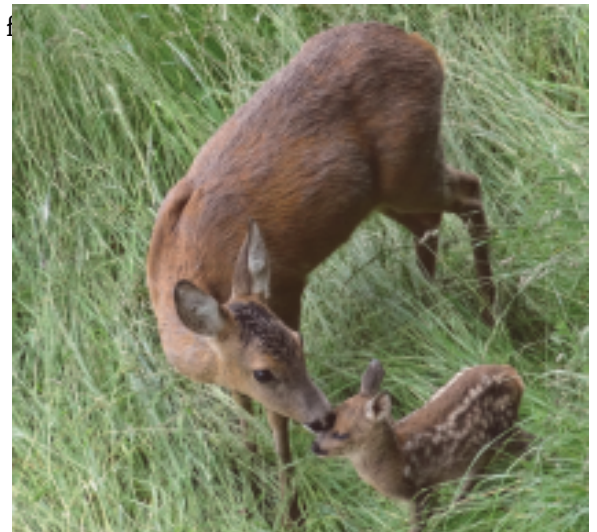
Geiß mit Rehkitz

Sie können helfen, wenn Sie Auffälligkeiten beim Wild feststellen, indem sie den zuständigen Jäger informieren.