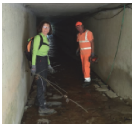
Wildbäche und Bachdurchläufe wurden überprüft.

Gemeinsam mit dem Bauhof entfernten die Mitarbeiterinnen Abflusshindernisse (Äste, etc) damit bei Starkregen keine Schäden entstehen.