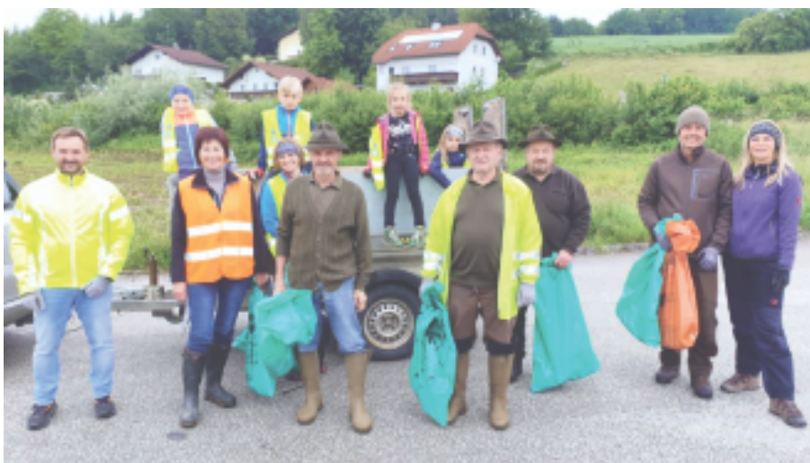
Die Jägerschaft sammelte fleißig im Ort und Umgebung.