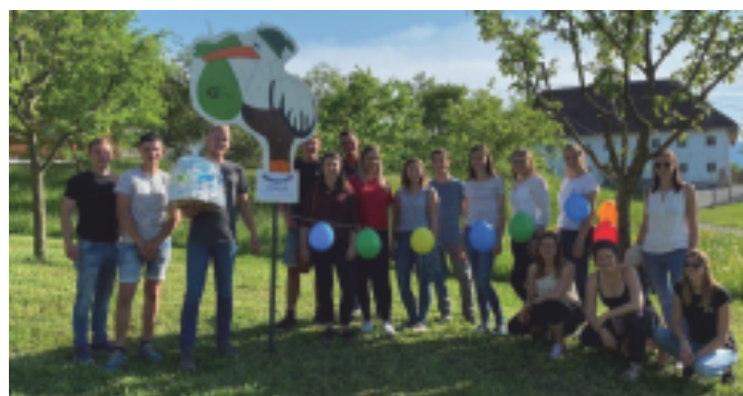
Der Storch ist gelandet!