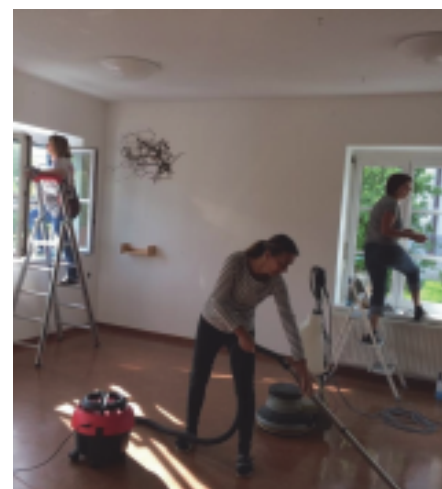
Die Kindergartenräume wurden mit viel Liebe und Eifer neu ausgemalt und hergerichtet.

Wenn über 90 Kinder täglich einen Raum benutzen, hinterlässt das Spuren. Alle Gruppenräume wurden daher ausgeräumt, neu ausgemalt und im Anschluss gründlich gereinigt und werden schon wieder zum Spielen und Lernen genutzt.