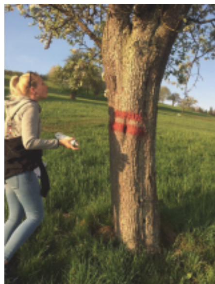
Wanderwege wurden saniert und neu markiert.

Die Beschilderung des Nussgeistweges und des Panoramaweges wurde geprüft und erneuert. Somit können sich auch ortsfremde Wanderer wieder