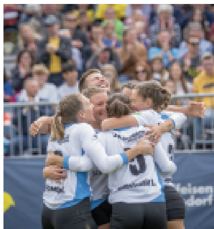
Meisterinnen 2021

Sportlicher Ausnahmezustand herrschte in Nußbach beim Faustball Bundesligafinale „Final3“ – und das aus gutem Grund. Eine großartige Veranstaltung mit vielen Gästen und perfekten Spielen bot sich den Zuschauern. Das Beste zur Krönung: Der Meistertitel 2021 für die Damen! Herzliche Gratulation zu diesem Erfolg! Besten Dank für gute Organisation des Spitzens – Wochenendes!