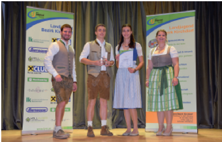
Auszeichnung der LJ Nußbach