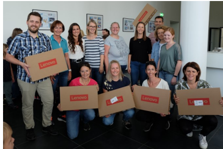
Der Elternverein durfte die Laptops im Rahmen des Schulstartfestes übergeben.

Die rückerstatteten Beiträge der Gemeinde Nußbach in der Höhe von € 3.800 wurden zur Gänze der Volksschule für die Anschaffung von Laptops zur Verfügung gestellt.