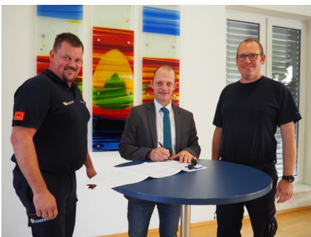
Unterzeichnung des Auftrages für ein MAN Kommandofahrzeug.

Gemäß dem Gemeinderatsbeschluss vom 15. September konnte in der darauf folgenden Woche das Fahrgestell für ein neues Kommandofahrzeug bestellt werden. Voraussichtlich wird im Dezember der Aufbau vergeben und das neue Fahrzeug mit ca. Ende 2024 in den Dienst der Feuerwehr Nußbach gestellt werden.