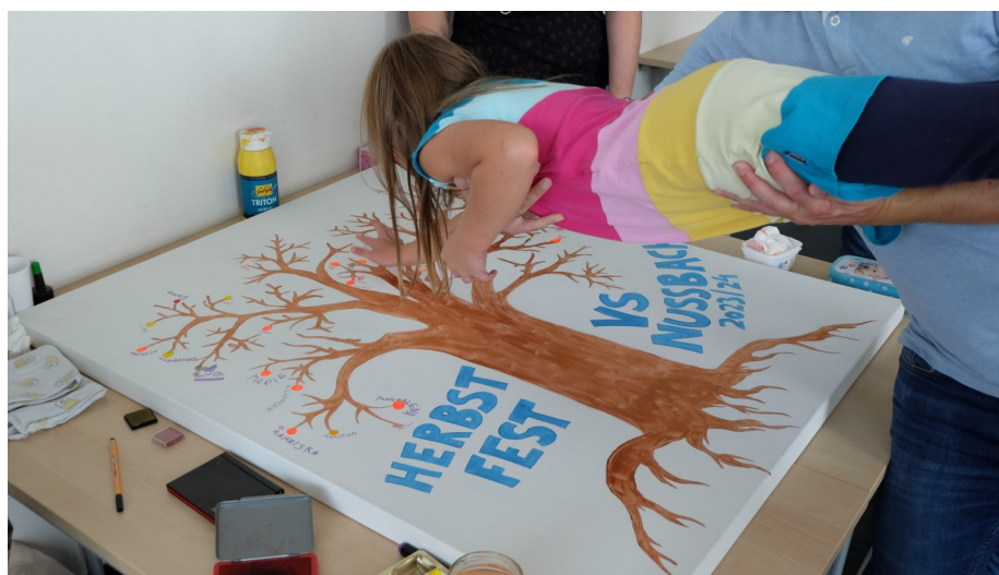
Viele Kunstwerke sind beim Schulstartfest entstanden.

Der Elternverein und die Volksschule Nußbach sagen Danke.