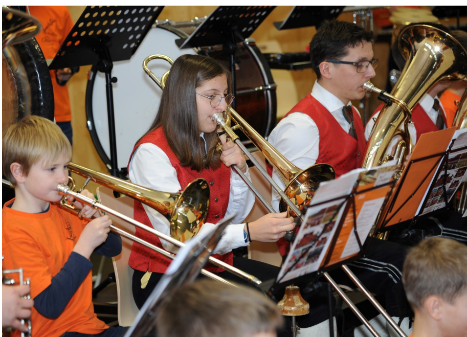
Die Mitglieder des Musikvereins beim Musizieren und Proben für das diesjährige Wunschkonzert.

Sa. 2. Dezember – 20:00 Uhr So. 3. Dezember – 14:00 Uhr mit Young Generation im Mehrzwecksaal der Volksschule Nußbach