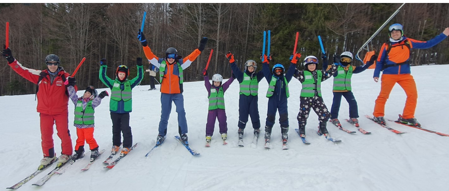
Die Kinder haben viel Spaß beim Skikurs.