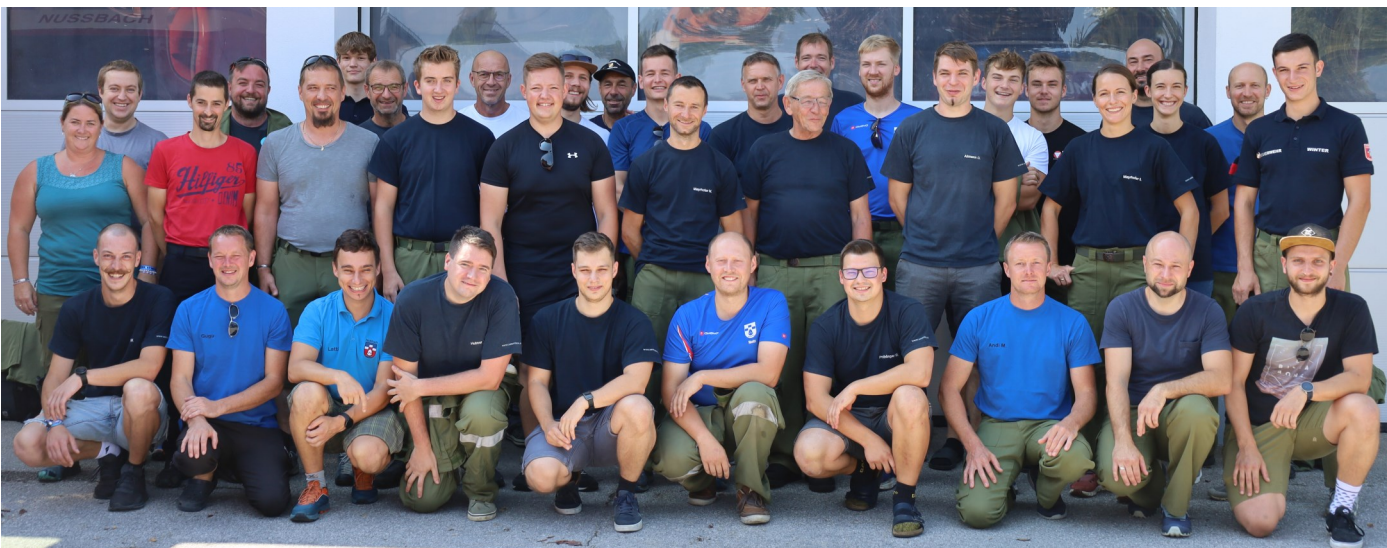
Die Teilnehmer der 4. Internen Feuerwehr-Ortsmeisterschaft.

Am 26. August wurde die 4. Interne Feuerwehr-Ortsmeisterschaft beim Nassbewerb in Zenndorf (Ried im Traunkreis) ausgetragen. Insgesamt 36 Mitglieder aus den Gruppen Nußbach, Göritz, Wimberg Umgebung-Natzberg und Wimberg eiferten um den Sieg. Mit einem fast perfekten Lauf holte sich die Gruppe Wimberg Umgebung-Natzberg nicht nur den internen Wanderpokal sondern auch den Gesamtsieg am Bewerb.