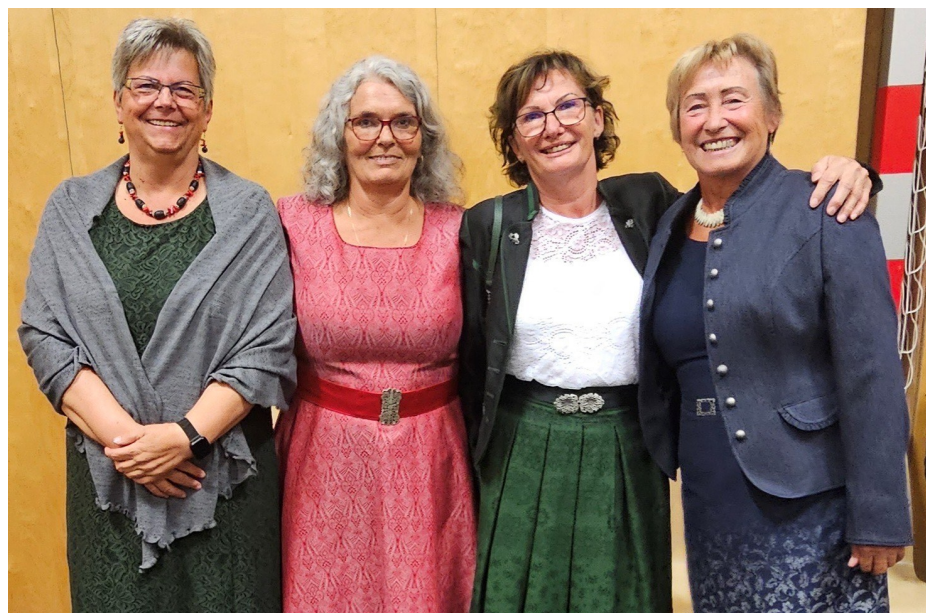
Bei der Trachtenmodenschau waren auch 4 Models vom PV Nußbach mit dabei.