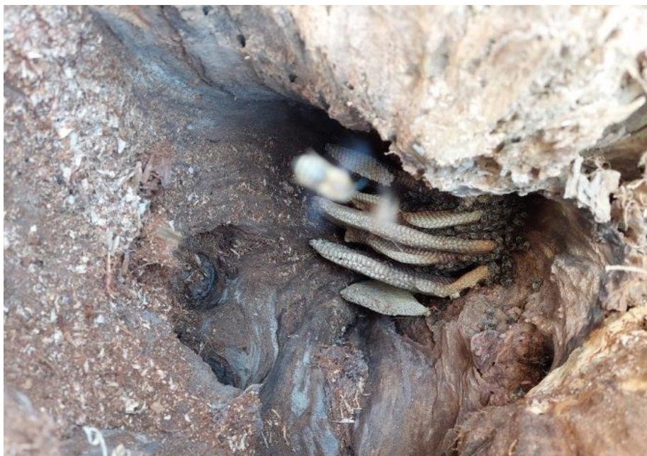
Der Naturbau des Bienenvolkes in der Baumhöhle.

Das Volk hatte etwas an dunklem Honig gesammelt. Einige kleine Wabenstückchen fielen bei der Aktion für die Kinder des Grundstücksbesitzers ab. Auch wenn der Sturm den Baum verschont hätte, wäre das Volk mit den eigenen Honigvorräten nicht über den Winter gekommen . Die Futtermenge wird nun ergänzt, indem das Volk von einem Vereinsmitglied mit Zuckerwasser