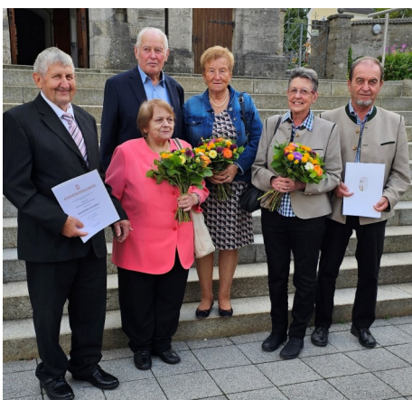
Die Paare bei der Jubelpaarfeier.

Bei der Jubelpaarfeier der Gemeinde Nußbach waren drei Paare aus unserem Verein, die heuer Goldene Hochzeit feierten. Dazu gratulieren wir sehr herzlich.