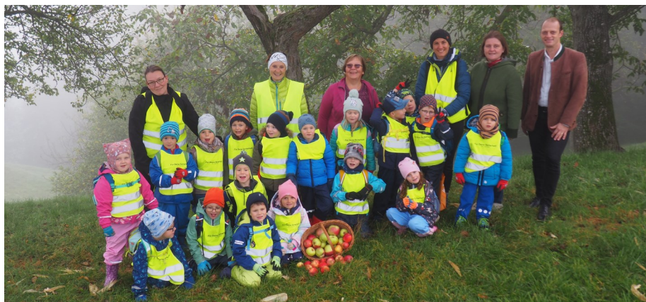
Der Kindergarten sammelt Äpfel.

Die Äpfel werden am 6. November 2023 an Schule und Kindergarten durch Vertreter der Gesunden Gemeinde Nußbach ausgeteilt.