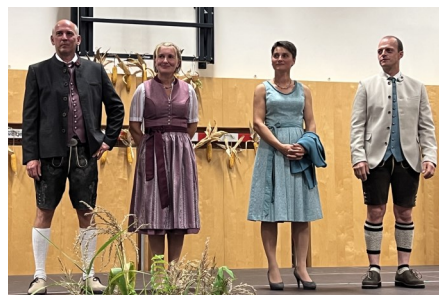
Einige der Models.