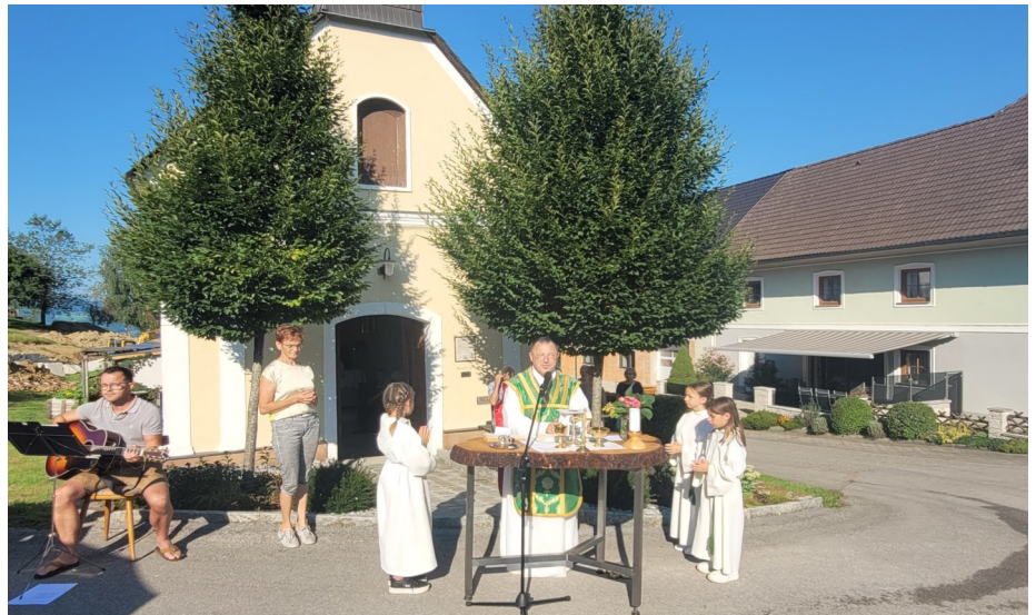
Die Gedenkmesse bei der Kapelle in Wimberg.

Mitgliedern, sondern es wurde zu einem Treffpunkt für Jung und Alt .