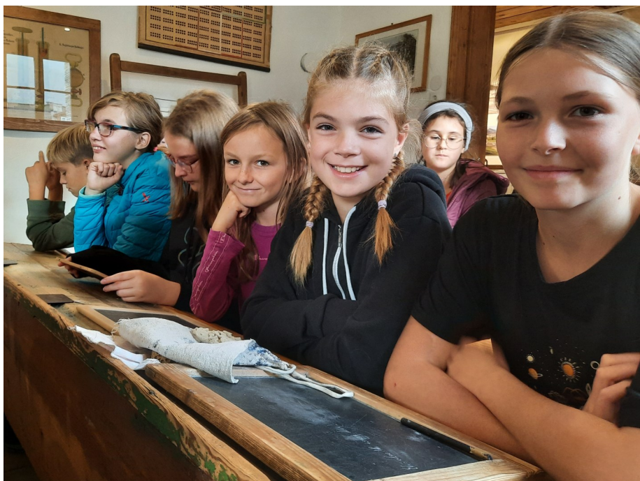
Schülerinnen und Schüler der ersten Klassen bei der Landschulwoche.

Ein erstes Highlight in diesem Schuljahr wird der Tag der offenen Tür sein. Am 17. November laden wir Interessierte aus Nußbach herzlich ein, unsere Schule zu besuchen und einen Einblick in unsere Bildungseinrichtung zu erhalten.